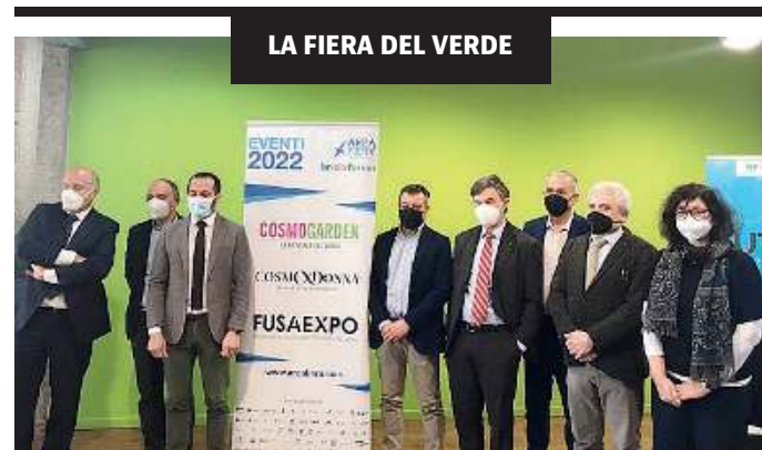
A Brixia Expo. Gli organizzatori della fiera Cosmogarden