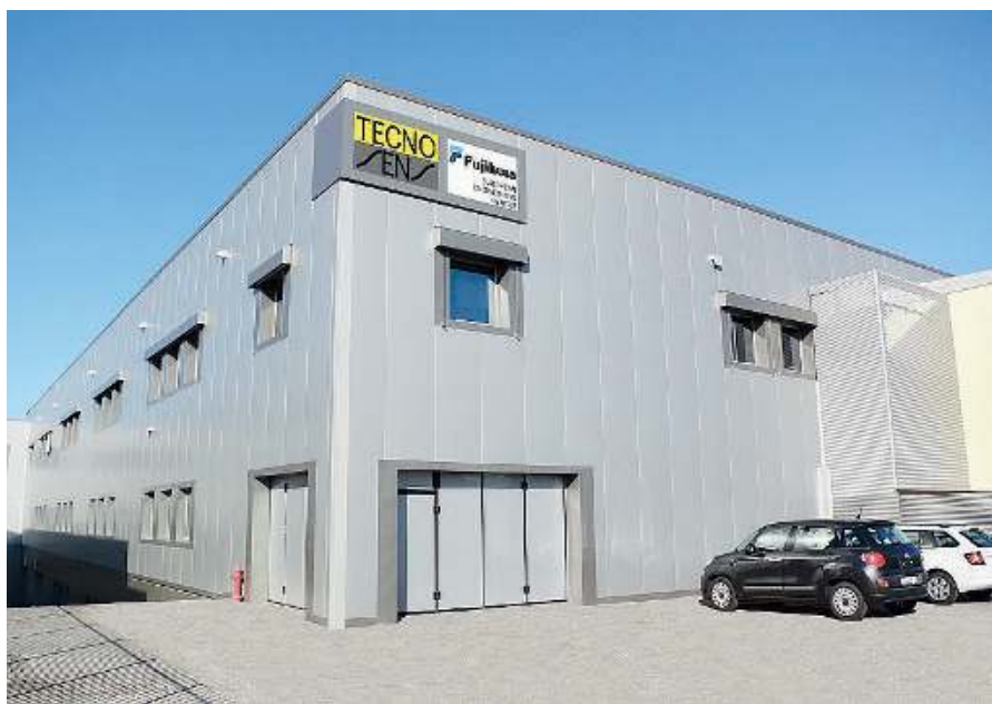
La sede a Brescia. Il quartier generale della Tecnosens